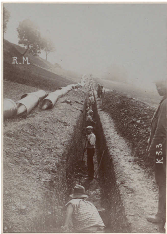
Ouvriers sur le chantier d'adduction des eaux dans le Pays-d'Enhaut.

Jusqu'au XIX e siècle, la distribution d'eau à Lausanne avait oscillé entre mains privées et mains publiques. Face aux besoins liés à l'explosion démographique et aux maladies qui frappent la population, la Ville de Lausanne décidait finalement de créer un service d'eau communal en acquérant une concession pour un volume d'eau des sources du Pays-d'Enhaut et en rachetant la Société des Eaux de Lausanne. L'année 1901 marquait ainsi la naissance du « Service des eaux de Lausanne ». Sur sa lancée, la Ville exécutait elle-même une conduite de 29 km entre Sonzier et le réservoir du Calvaire à Lausanne et après deux ans de travaux, l'eau du Pays-d'Enhaut alimentait Lausanne.