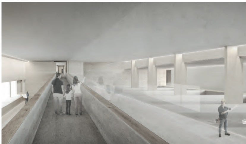
Vue extérieure et intérieure de la future usine.

© Bureaux Juan Socas Architecte et Mar & Boris