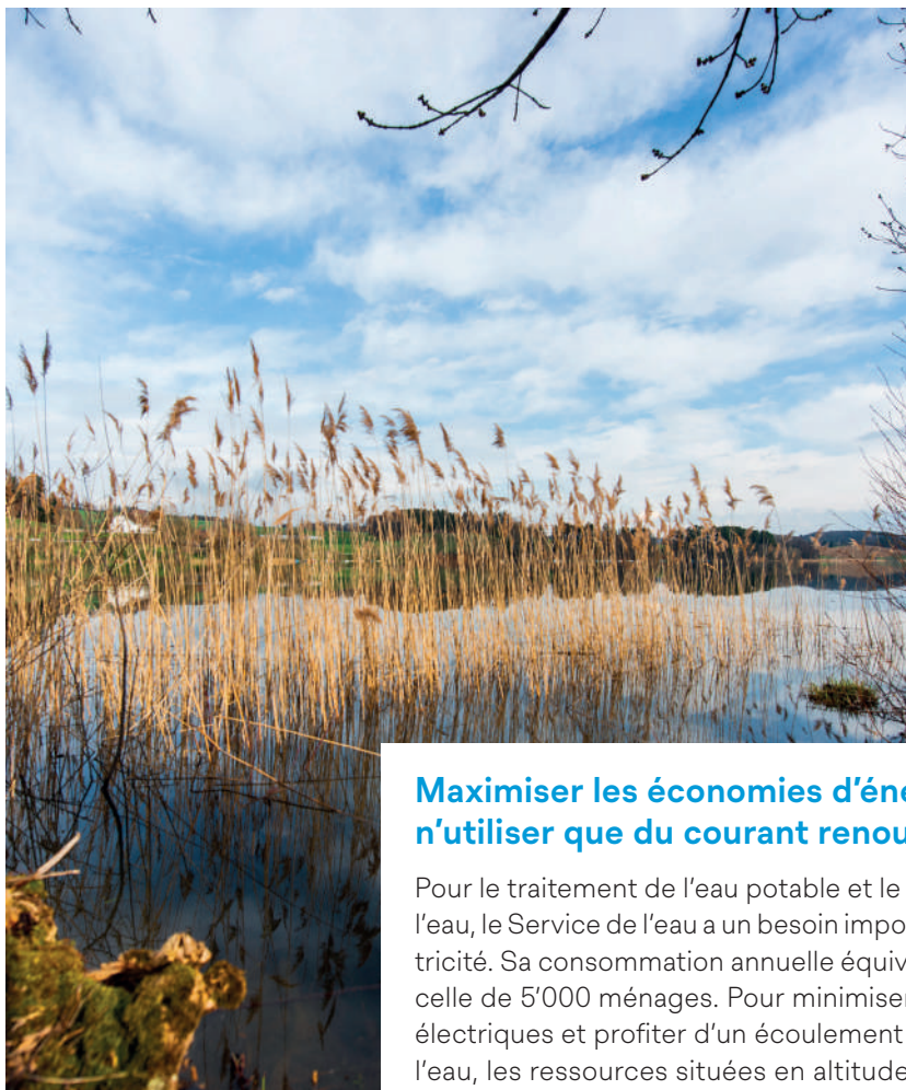
Lac de Bret.