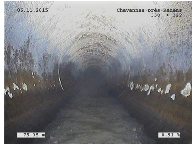
Dégradation de la paroi de la canalisation