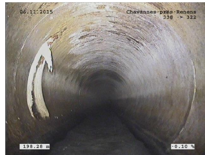
Formation de calcaire