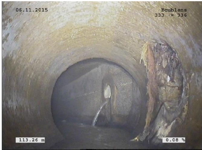
Branchement non étanche, pénétrations de racines