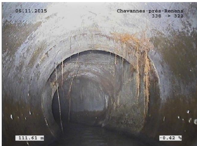
Pénétration de racine