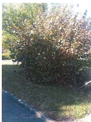
Arbre n°1 DN 90 cm Type noisetier