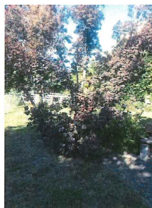
Arbre n°2 DN 60 cm Type arbre à perruques

Conformément à l'article 5 du règlement communal sur la protection des arbres, l'abattage de ces deux arbres est assorti d'une arborisation compensatoire. A cet effet, une plantation par un paysagiste, de deux arbustes d'essence indigène. À savoir, un Coryllus avellana 200/250 cm et un Cornus mas 200/250 cm sera réalisée.