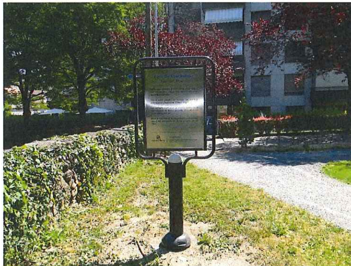
Figure 7 : Exemple de panneau d'information

En plus de la promotion traditionnelle (site de la commune, journal local, application de l'Ouest Lausannois), un panneau d'information vantant les avantages du parcours ainsi que les spécificités des machines sera disposé près de ces appareils, (très probablement) au parc du Débarcadère.