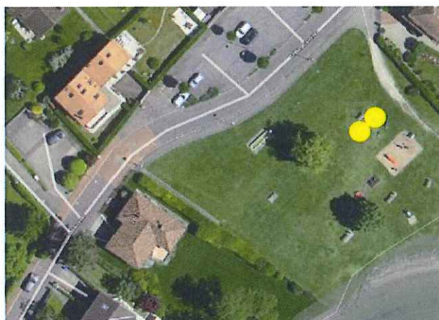
Figure 5 : Emplacement des agrès au parc des Pierrettes