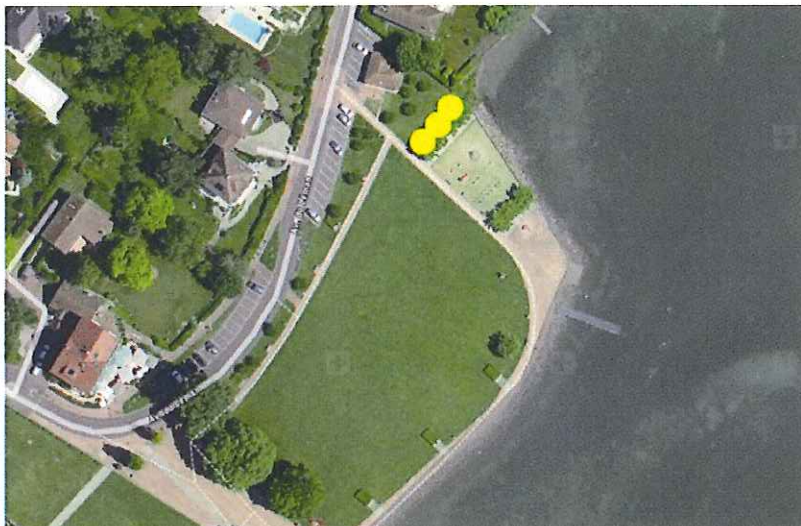
Figure 4 : Emplacement des agrès au Débarcadère