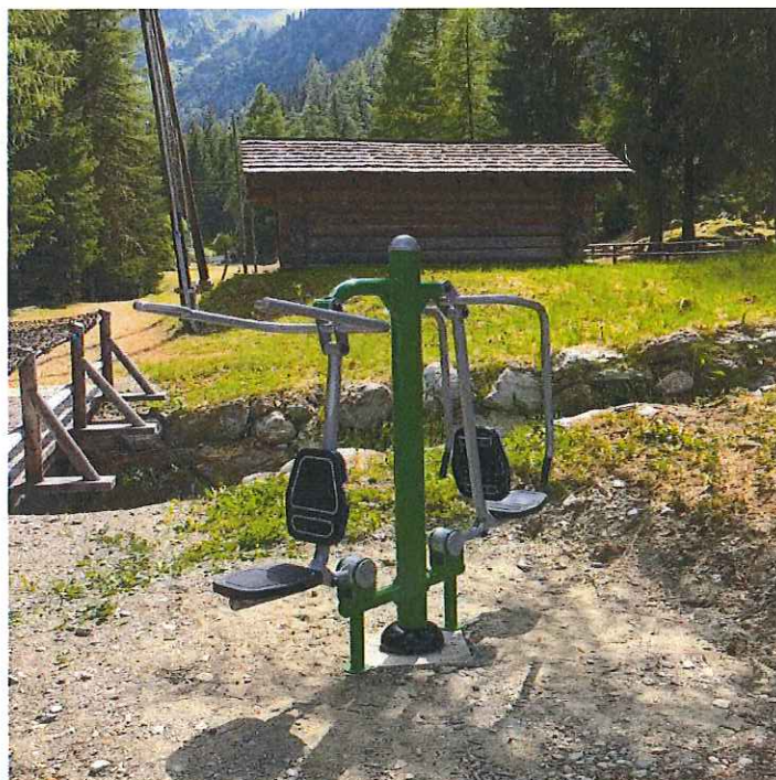
Figure 3 : Photo du modèle "tireur & pousseur"