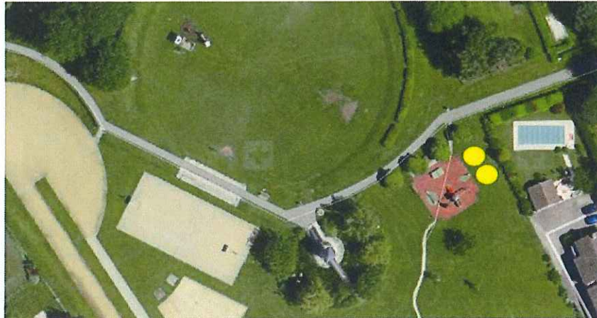
Figure 6 : Emplacement des agrès au parc du Russel