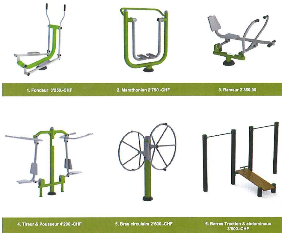
Figure 2 : Engins sélectionnés (à l'exception du 4 - "tireur & pousseur")