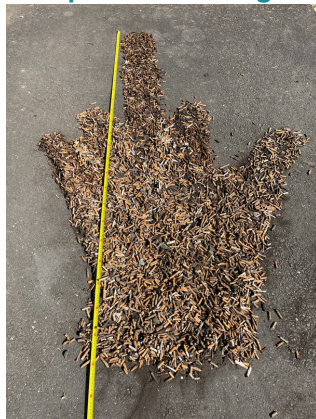
17'340 mégots collectés à Yverdon