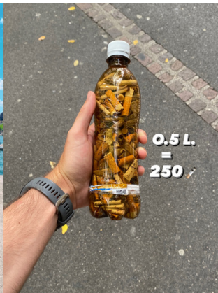
250 mégots collectés à Morges