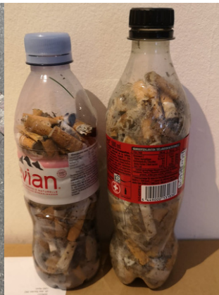
500 mégots collectés à Nyon