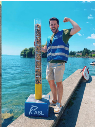
4'000 mégots collectés à Rolle