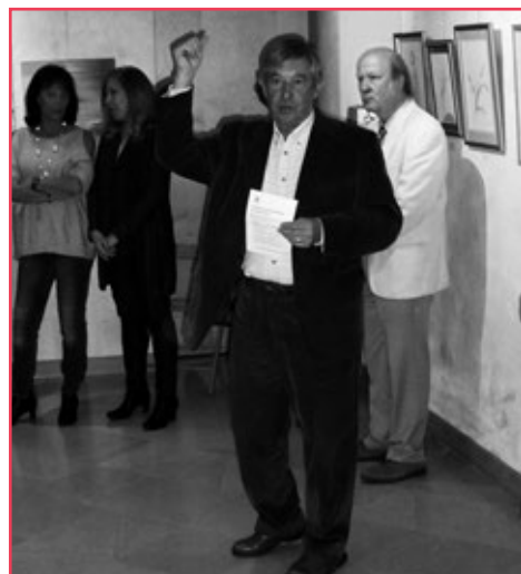
Le président pendant son allocution et, à gauche, les deux organisatrices.