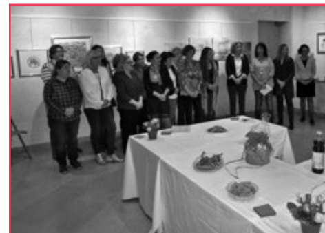
Présentation des artistes.