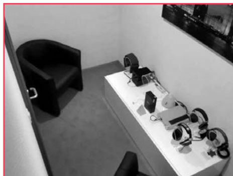
Une cabine acoustique de test d'écouteurs High-end.