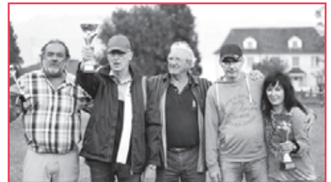
Les gagnants 2016. Serez-vous les gagnants 2017? Pour le savoir venez le 13 mai au parc du Russel!