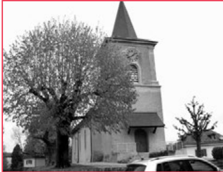
Temple du Motty.

culte de l'aube à 6h au temple du Motty suivi d'un petit déjeuner. Ou à 10h à l'église romane à St-Sulpice.