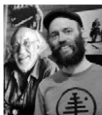
Père et fils.

Quelques mois après une exposition de photos à laquelle son fils a participé, Derib père est venu présenter des planches et promouvoir ses albums, invité par la Société de Développement. Le 1 er