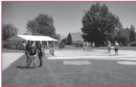
Emplacement des terrains au parc du Russel.

Le tournoi de pétanque commencera à 11h00.