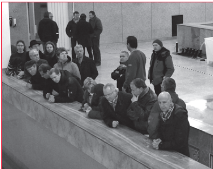
Régénération des lits de sable.