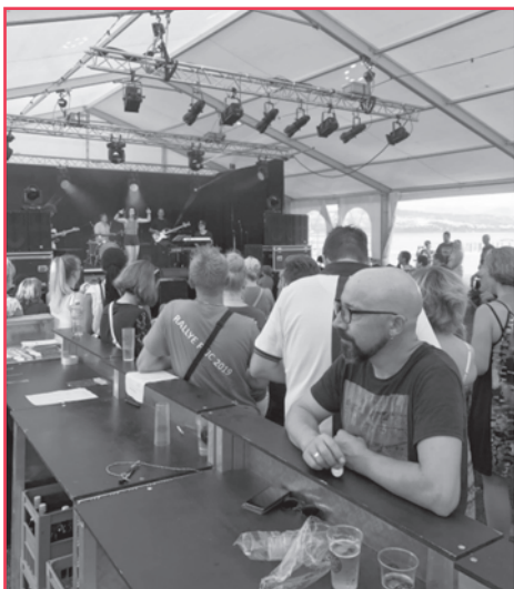
Un aperçu de l'ambiance de la fête.

Le comité d'organisation de la fête de la musique