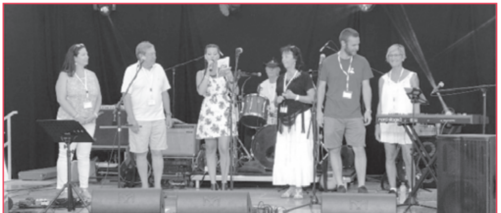
Le comité d'organisation.