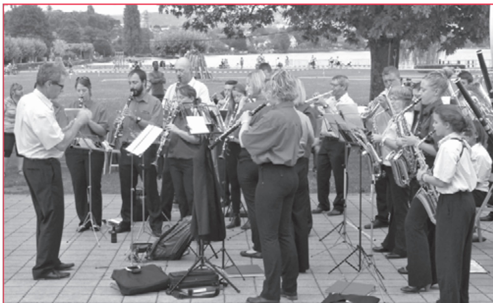
L'Echo de Gavot.